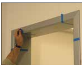
THYS montagelijm Ref. 263410

Plaats aan de deurzijde de chambranlen op de deurkast. Plaats ze 8 mm verwijderd van de binnenzijde van de deurkast en houdt de gelemen chambranlen op hun plaats met een kleefstrip tot de hechting heeft plaats gevonden (±25min.). Deze 8 mm spatie verhindert het slaan van de dagschieter op de deurlijsten. Gebruik hiervoor de speciaal ontworpen THYS MONTAGELIJM. Ze heeft een hoge aanvangshechting en voorkomt beschadiging van chambranlen door vernageling. Is reukloos, overschilderbaar en geschikt voor vochtige ruimtes alsook voor beglazing.