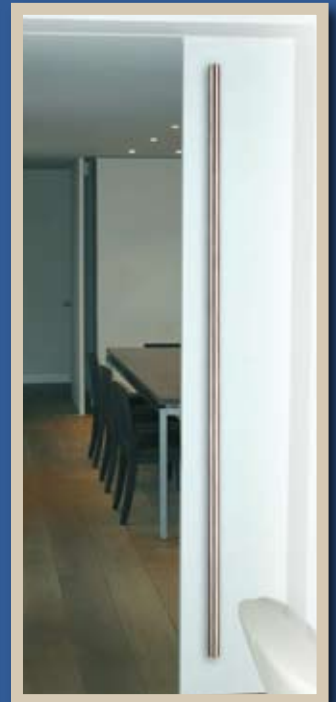
greep ref. 169125 lengte 1800 mm x 32 mm