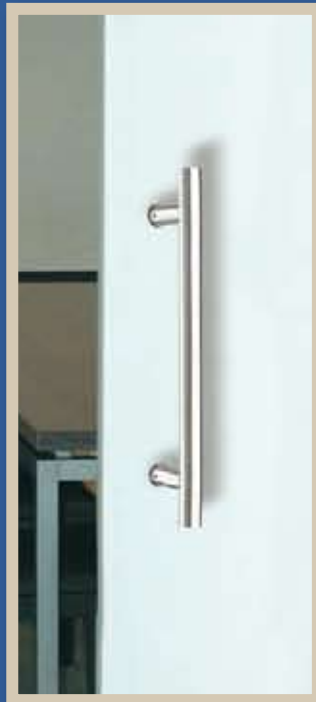
greep ref. 017433 400 mm x 25 mm