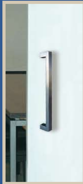
greep ref. 263465 319 mm x 20 mm x 20 mm